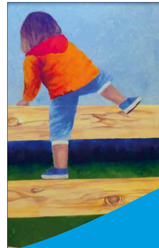
Gestaltung: ermdesign+kunst.projekte, Aachen

Ansprechpartner: OStD i.K. Olaf Windeln M.A. Bismarckstraße 24, 52351 Düren Telefon: 02421 160 41/42 Fax: 02421 207 9642 Email: schulleitung@angela-dueren.de www.angela-dueren.de